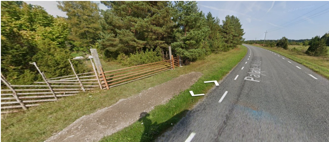
Joonis 1 Vaade olemasolevale väravale